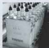
高圧コンデンサー