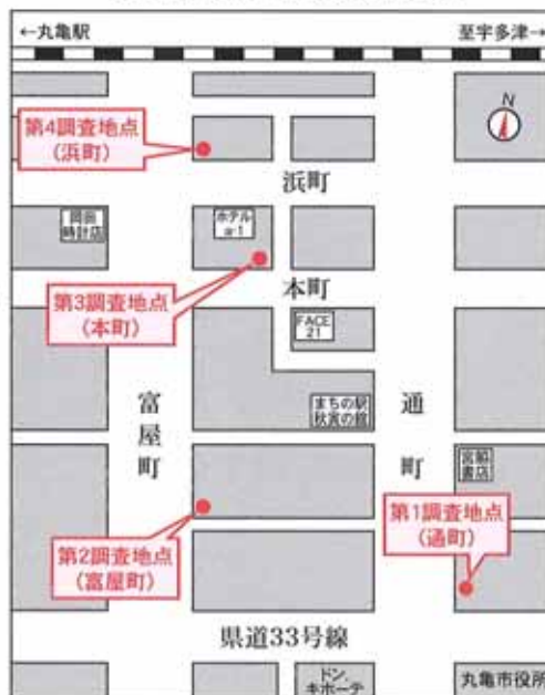
通行量調査地点概略図

次に、24日(月)の調査では、全体の総通行量が3,787人、前年対比0.3%の増加となり、日曜日と比較すると約1.3倍の通行量がありました。通行量の多い順番は、通町、浜町、本町、富屋町となっており、女性の通行量割合が約50%と日曜日と比較すると高くなっています。また、年齢別でみると男女合計で31歳以上が約70%を占めており、2日間で通行者の年齢層には変化がみられませんでした。