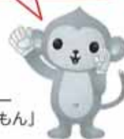
香川県ゲートキーパー 推進キャラクター「きーもん」

香川県の平成28年の自殺者数(速報値)は 170人(前年比8人増) 。 年代別では、 30代から60代の働き盛りの男性 の自殺が多くなっています。