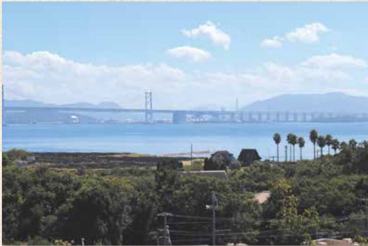
現在の本島レジャーセンター跡地