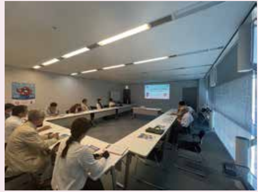
▲大阪・関西万博の説明を受ける様子

来年は瀬戸内国際芸術祭も開催され、3年前と違い新型コロナウイルス感染症の影響も無いため、万博開催によるインバウンド効果とも相乗し「経済効果」や「観光振興、交流人口拡大」、「地域活性化」へ大きな効果が期待できます。当所も行政等と連携し、国内外から多くの観光客が期待でき、香川県や丸亀市の魅力の創出・発信する一助になればと決意を新たにしました。