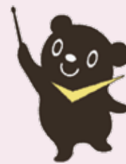
最低賃金制度のマスコット チェックマン

最低賃金に関する問い合わせ先… 香川労働局労働基準部 賃金室 (TEL:087-811-8919)