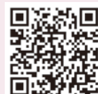
▲届出事項変更用紙

会員事業所の皆様の中に、事業所名や代表者名、所在地、営業種目、電話番号等に変更がありましたら、誠にお手数ですが、当所HPに掲載しています届出事項変更用紙に変更箇所をご記入いただきFAX(22-2859)にて当所までご連絡ください。