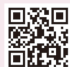
▲中小企業省力化投資補助金HP

※補助上限額を引き上げたが事業終了までに賃上げ未達の場合は、補助額の減額となります。