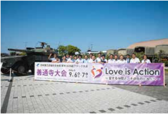
▲自衛隊善通寺駐屯地内で記念撮影

青年部は、9月6日(金)、7日(土)にかけて開催された、日本商工会議所青年部第41回四国ブロック大会善通寺大会に参加しました。本大会は日本YEGが主催する三大大会の一つで、毎年全国の9ブロックにおいて主管地の特色を活かした大会が開催され、大勢のYEGメンバーが各地へ集い、交流と研鑽を重ねています。四国ブロックでは4県が持ち回りで開催しており、香川県としては令和2年度の丸亀大会に続き、善通寺YEGが本年度の主管団体を務めました。