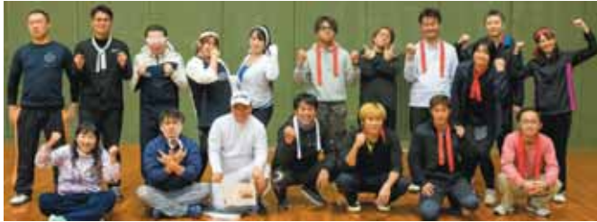
▲健闘を称え赤組と白組で記念撮影

今年はパリオリンピック・パラリンピックがあり、香川県出身の金メダリストが誕生するなど、日本中がスポーツで大いに沸いた年でもあります。青年部では普段からスポーツに慣れ親しんでいるメンバーもいれば、そうではない者もいることから、玉入れ、綱引き、バドミントンなど、初心者でも楽しめるプログラム構成としました。