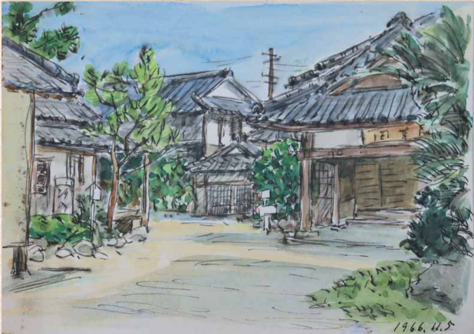
社会教育の拠点であった旧公民館(スケッチ:村上泰郎 所蔵:丸亀市立資料館)