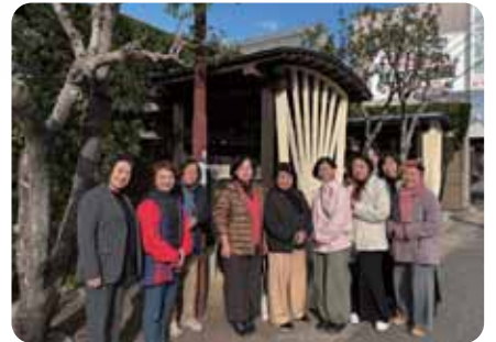
▲南条町遍路道休憩所の清掃 参加者

2025年も女性会活動の強化・会員増強に努め、会員の協力のもと、毎月の定例会・講習会の開催、香川県連・四国連・全国大会への参加・各種事業への協力を積極的に行い、実りある一年にしたいと思います